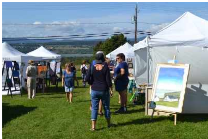
Symposium extérieur Art et Moisson.