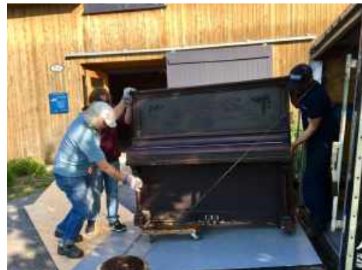
L'arrivée à l'Espace du piano de la famille Leclerc.

En novembre 2019, faisant suite à la parution un an plus tôt de l'album Héritage : hommage à Félix Leclerc , un spectacle est présenté par l'Orchestre symphonique de Montréal et plusieurs jeunes artistes québécois à la Maison symphonique de Montréal .