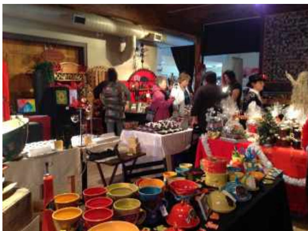
Des artisans au Marché de Noël.